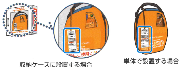
収納ケースに設置する場合

AEDを設置する際は、電極パッドの使用期限とバッテリーの 使用開始日の表示が、必ず見えるように設置してください。